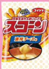
2018年頃のパッケージ