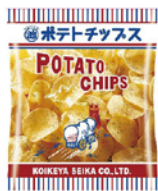
湖池屋ポテトチップスののり塩 初代パッケージ