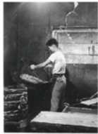
創業当時の釜揚げの様子

当時は「塩味」が主流でしたが、「せっかく日本でポテトチップスを作るのだから、日本人になじみのある味にしよう！」と研究を重ね、「のり塩」を開発し発売にいたしました。その後、1967年にポテトチップスの量産化に成功し、日本におけるポテトチップスのパイオニアとしての一歩を歩み始めました