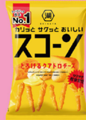
現在のパッケージ