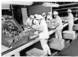
量産化されたポテトチップス製造ライン